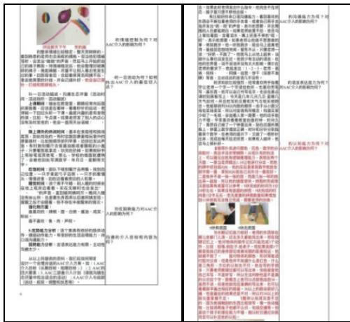
圖2 案例說明畫面（左欄為案例說明，右欄為討論題綱）