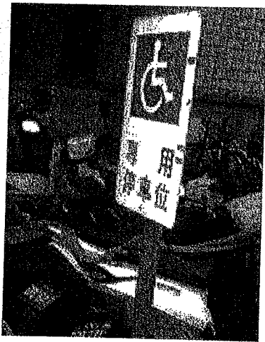
圖 1： 身心障礙者專用停車位標誌

本文旨在找出身心障礙者停車之相關的法條及罰則，並分享筆者於停車現場的觀察實例與心得。