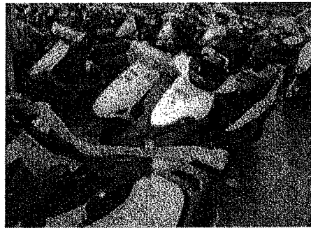
圖 2 身心障礙者專用停車位使用現況