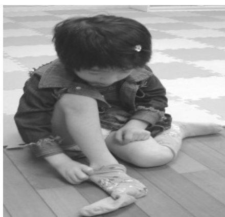
穿襪子練習 → 短襪 → 中長襪