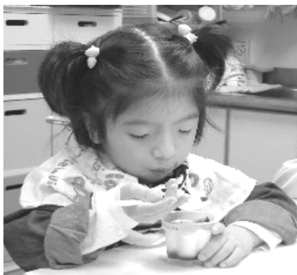
可以自行獨立吃完一個布丁