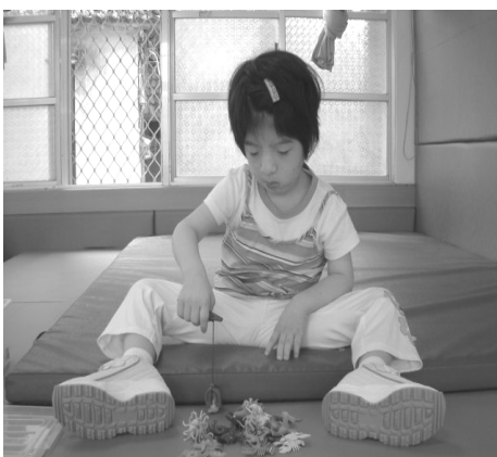
活動名稱：釣魚樂 活動目標：增強抓握的能力