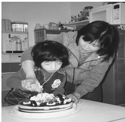
活動名稱：慶生會(我長大了) 活動目標：體會生日的快樂、 懂得分享