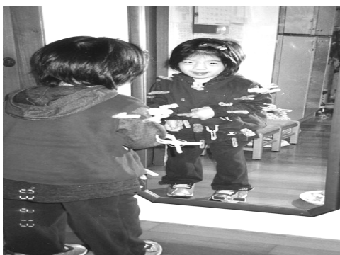
活動名稱：夾衣夾(三指捏) 活動目標：三指捏的能力訓練、