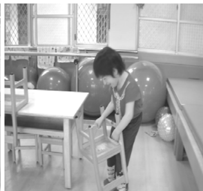
仔細瞧一瞧，她是那麼用心的做好每一個動作

在一個午休之後的下午，老師為了打掃方便把椅子搬到桌子上放，妹妹起床了，她要坐坐。就自個兒將椅子搬下來，在老師鼓勵之下她全包了，一共有 10 張椅子。重點：她搬椅子的每一個動作是那麼的小心翼翼，在老師的從旁叮嚀聲中（要小心喔！輕輕的喔！）竟然沒有發出絲毫的撞擊聲，而且認真的態度真叫人感動。