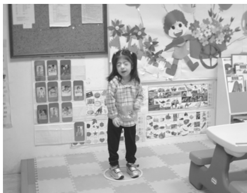
被罰站了，趁老師不在，快偷跑吧！