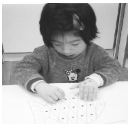
活動名稱：貼小圓圓 活動目標：手眼協調訓練