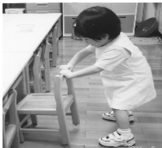
日常生活常規訓練： 離開位子會將椅子歸位