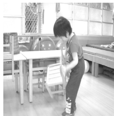
這項工程我的畢業考呢！完成了，我就可以畢業了！