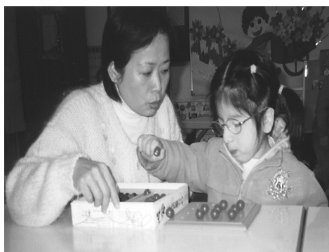
活動名稱：排珠珠(二指) 活動目標：加強二指捏的能力