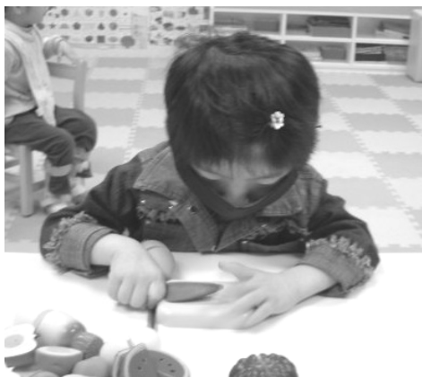
活動名稱：切水果 活動目標：增強抓握的能力、 專心度的培養 認識蔬菜水果