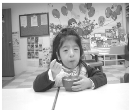
可以獨立吃完七分滿的稀飯