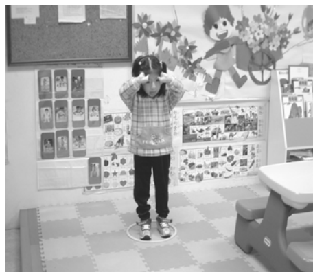
嗯~~考慮一下喔！可以嗎？