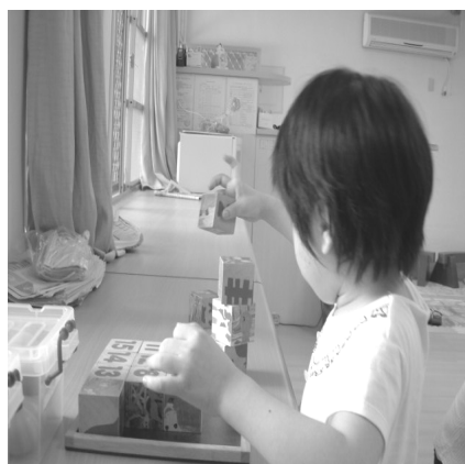
活動名稱：疊積木 活動目標：增強抓握的能力、 手眼協調的訓練、 數數練習 1-10