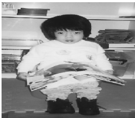
如廁訓練：目的-撤除包尿布的習慣