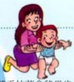
雙手拉著會移幾步