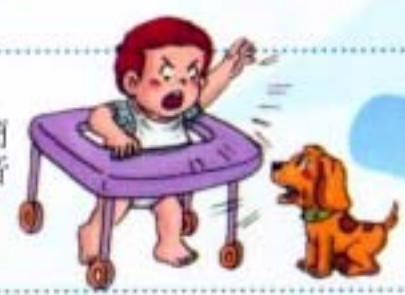
會摹仿簡單的聲音