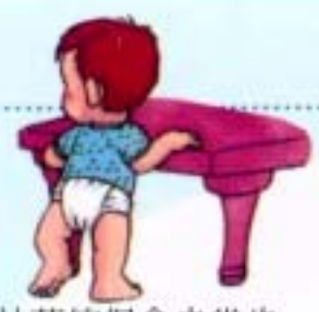
雙手扶著傢俱會走幾步