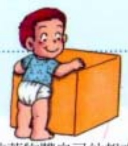
拉著物體自己站起來