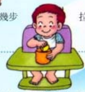
會把一些小東西放入杯子